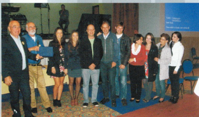
Delegação de Telêmaco Borba/PR